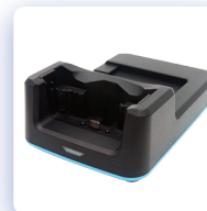
Ethernet-подставка с отсеком для аккумулятора