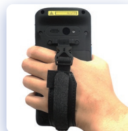
Ремешок на руку